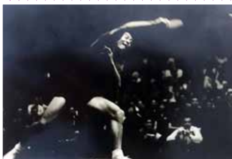
▲ 李富榮(1942 - ) 上海人 1961年世界錦標賽男團冠軍成員；1961、63和65年世界錦標賽男單亞軍（冠軍俱為莊則棟）