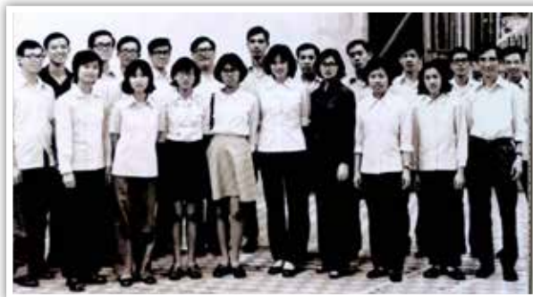
▲ 任教民權中學的校友合照