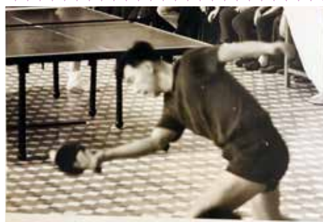
▲ 張燮林(1940 - ) 上海人 1961年世界錦標賽男子單打季軍（冠軍是莊則棟，亞軍是李富榮）