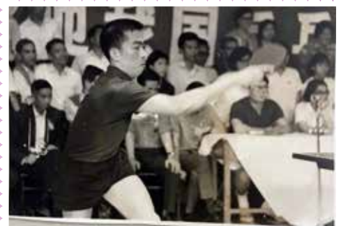
▲ 梁戈亮(1950 - ) 廣西玉林人 1971年世界錦標賽男團冠軍成員