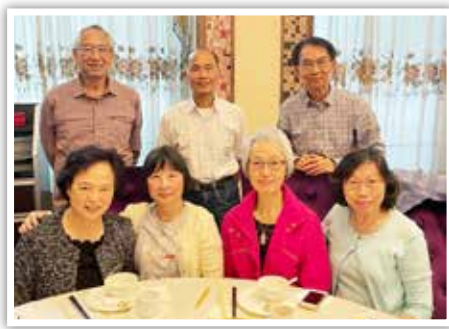
▲ 旅居加國校友相聚

(寄上懷念民權老師詞一首，這裡有二十三位老師的名字。民權是一所愛國學校，老師絕大部分是香島校友。分別幾拾年在網路上重逢，感慨萬千。此詞除了懷念老師們之外，更是懷念黃葉治老師，她不久前離我們而去。她的愛心種子灑滿人間，灑滿鳳鳴山顛。我們懷念你黃老師！謝謝你們！)