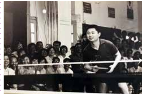
▲ 徐寅生(1938 - ) 上海人 1961年世界錦標賽男團冠軍成員