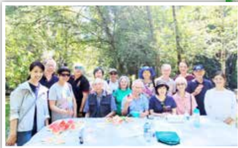
▲ 步行完齊齊嘆美味西瓜