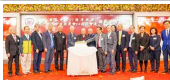
▲ 慶祝生日，切蛋糕儀式