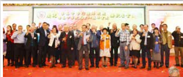
▲ 香島校友會祝酒儀式