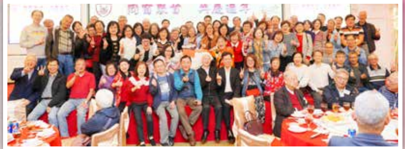
▲ 畢業50週年27屆校友開心大合照