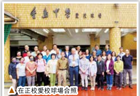
▲在正校愛校球場合照

透過今次的參觀，對母校的發展和近況有所了解，看到三校學生們在課室認真上課，在操場輕鬆活動，個個朝氣勃勃，充滿活力，我們放心了，因為感覺到「自有後來人」。