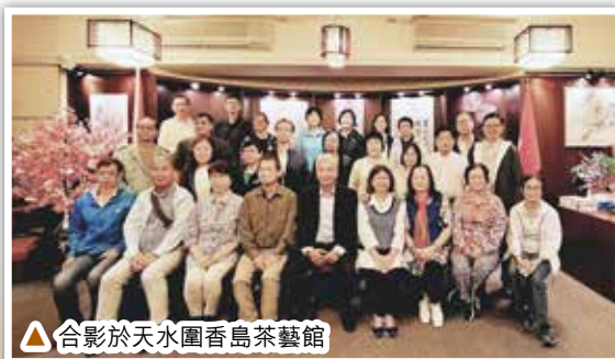
▲合影於天水圍香島茶藝館