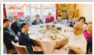
◀ 參加聚餐校友合照