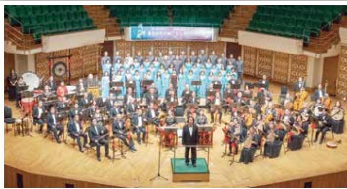
▲ 民樂團合唱團雙劍合璧表演「我的祖國」