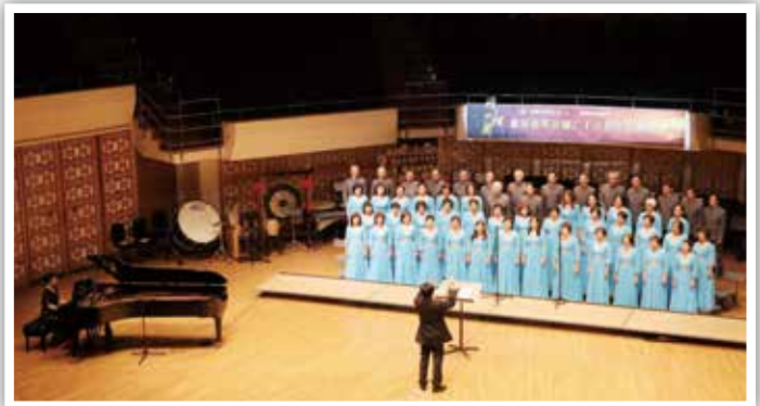
▲ 香島校友會合唱團大合唱

見得愛國學校多年種下的樹苗，根基是多麼牢固！今天已經綠樹成蔭，人才輩出！校友的愛國熱情不減當年！恭喜！恭喜！」