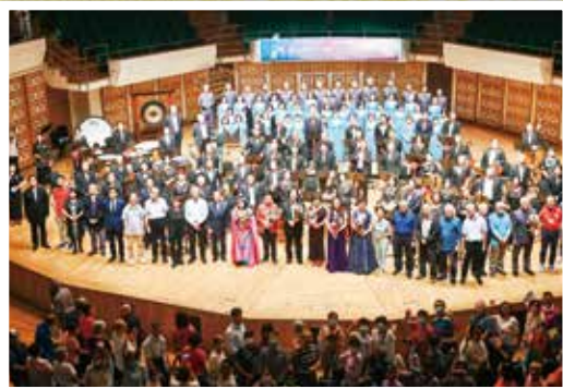
▲ 演出人員和出席嘉賓大合唱