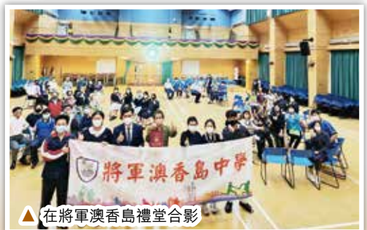
▲在將軍澳香島禮堂合影